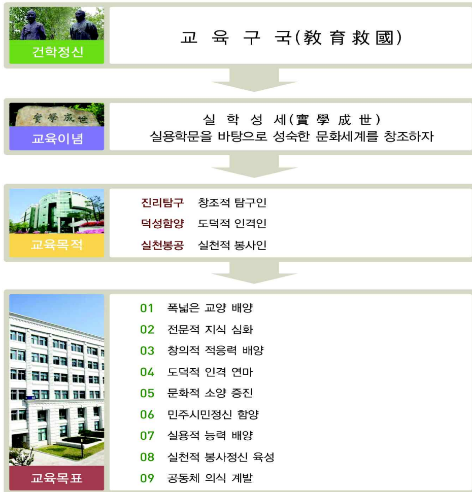
[그림 II-1] 교육 이념 · 목적 · 목표