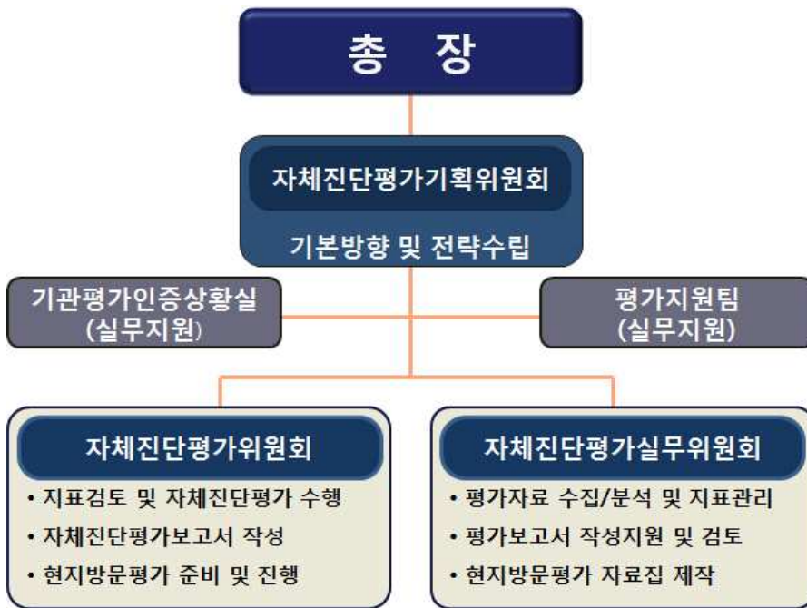
[그림 1-1] 자체진단평가 추진체계